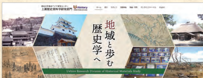
部門ホームページ