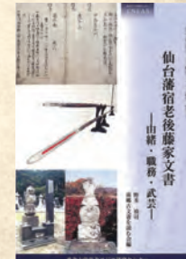
東北アジア 研究センター叢書