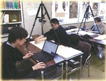
古文書整理の様子

現在、各地で近世古文書の保全活動を進めている東北アジア研究センターご指導のもと、デジタルカメラで古文書のすべてのページを撮影し、目録を整理しなおすことで、原本の保全と活用を両立・促進する取り組みを行っています。このテーマ展では、再整理で撮影した古文書の画像や原本を展示し、江戸時代の人々の暮らしに触れていただきます。過去の人々のくらしと地域の歩みを知ることで、歴史から学び、現代や未来を考える一歩としていただければ幸いです。